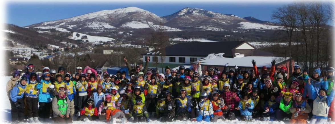
第6回デフわんぱくスキー・スノーボード教室(長野県菅平高原スキー場)