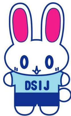
指導員会マスコット ラビスキー